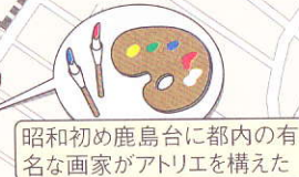
昭和初め鹿島台に都内の有名な画家がアトリエを構えた